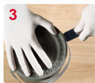
3 AL ABRIR, EVITE DAÑAR LA TAPA