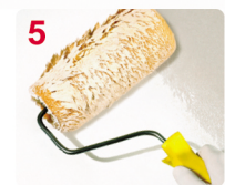
5 PINTE ARRIBA / ABAJO