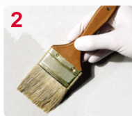
2 APLIQUE SELLADOR FIJADOR