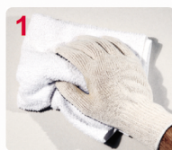
1 LIMPIE LA SUPERFICIE A PINTAR

Se puede aplicar a pincel, rodillo o soplete airless. Se recomiendan entre 2 y 3 manos, según el grado de protección deseada.