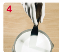
4 MEZCLE BIEN EL CONTENIDO