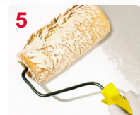
5 PINTE ARRIBA / ABAJO