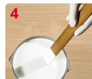
4 MEZCLE BIEN EL CONTENIDO