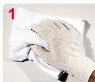
1 LIMPIE LA SUPERFICIE A PINTAR

Se puede aplicar a pincel, rodillo o soplete airless. Se recomiendan entre 2 y 3 manos, según el grado de protección deseada.